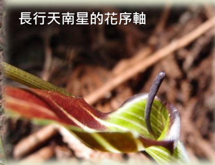
長行天南星的花序軸