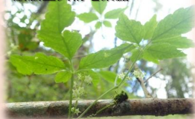
絞股藍又稱七葉膽