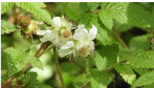
H. 紅腺懸鉤子的潔白花。