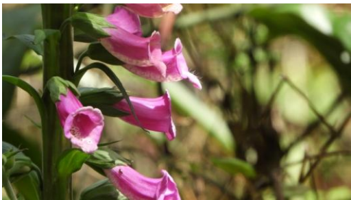
G. 毛地黃的鮮豔花朵。