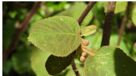
A. 臺灣羊桃的初生葉。

走入森林中，可以發現到一條又一條的藤蔓懸掛在樹上。仔細一看原來是臺灣原生種的奇異果——臺灣羊桃。臺灣羊桃是一種落葉性的木質藤本，常見於中海拔的森林中。不論是在莖或葉子上都有淡褐色的毛，所以摸起來的觸感很舒服。春天開花，秋天結果。而臺灣羊桃的莖也可運用在花藝作品內，呈現出別致的線條美。