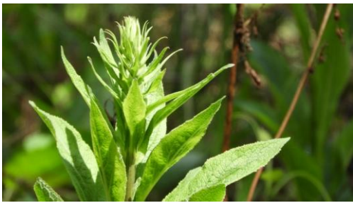
F. 毛地黃的未展開花苞。