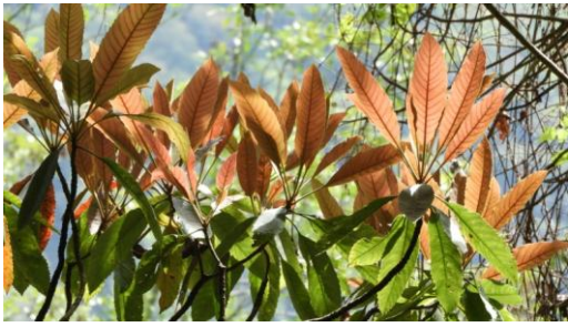
D. 臺灣枇杷的初生葉。