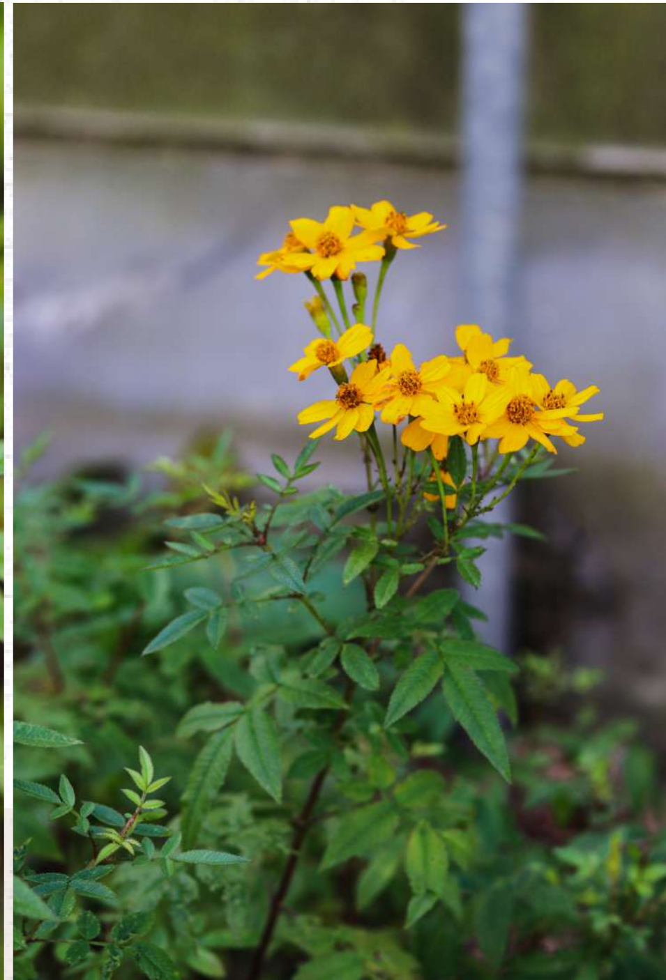
芳香萬壽菊 Tagetes lemmonii

為農場內的一種常見香草，冬季至春季為花期，花呈現金黃色，香草會有迷人的香氣正是因為全株佈滿油胞，輕觸碰油胞即破裂釋出香味，只要生長在日照充足的環境，香味會顯得十分濃烈，種植在經濟作物旁也能有效降低害蟲聚集。