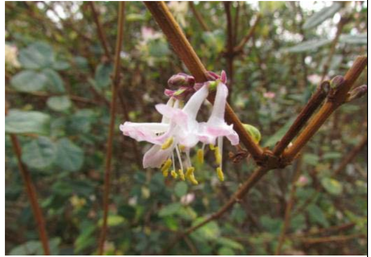
追分忍冬 Lonicera oiwakensis Hayata

臺灣特有種，分布於中北部中海拔山區，1907年2月由中原源治在霧社採集，故以霧社命名。霧社山櫻的花色純白清透，花型小而細緻，與一般粉色系櫻花相較，顯得清麗脫俗。