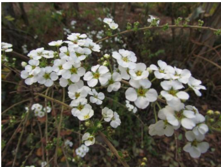
臺灣笑靨花 Spiraea pseudoprunifolia Hayata

臺灣特有種，模式標本於1916年4月21日由早田文藏在追分(oiwake，今翠峰)採集。開花時雙花並蒂，雄蕊的黃色花藥伸出花筒，像是跳著雙人舞蹈的舞者；白花中帶有紅暈，十分可愛。