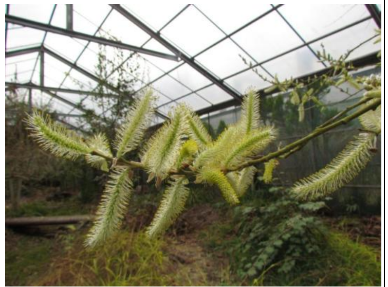
褐毛柳 Salix fulvopubescens Hayata

每當春天來臨，行走在中海拔山路上，看見串串枝條綴滿雪白小花，搖曳在春風裡燦笑，大概就是它了。繡線菊屬名由希臘文 speira (捲旋)而來，意指其一輪5片花瓣呈捲旋狀排列。