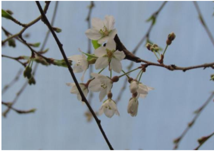
霧社櫻 Prunus taiwaniana Hayata

2月仍冷冽刺骨，然而有些植物已經悄悄甦醒：霧社櫻、臺灣笑靨花、追分忍冬、褐毛柳是春的使者，率先綻放花朵，預告春天即將來臨。