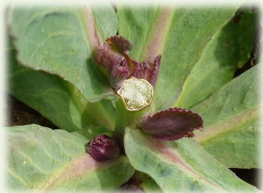
寒流來襲，凍到發紫的高麗菜芽。

冬季是梅峰農場休養生息的時候。然而，不同海拔高度的臺大山地實驗農場附設春陽分場，卻是異常忙碌。