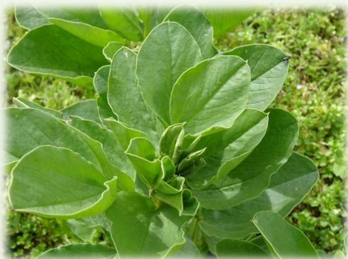
休養中的梅峰，種植蠶豆等綠肥作物。

春陽分場位於海拔1260-1600公尺的仁愛鄉春陽村，年均溫18°C左右，屬副熱帶型氣候。梅峰農場休耕期間，春陽分場的雜作生產不僅可彌補蔬菜供應量不足的問題，其培育的蔬菜種苗，也在為春季的梅峰農場做準備。