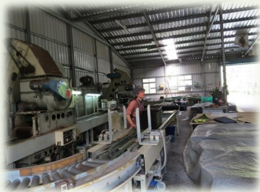
民國八十七年啟用的自動播植機。

春陽分場位於海拔1260-1600公尺的仁愛鄉春陽村，年均溫18°C左右，屬副熱帶型氣候。梅峰農場休耕期間，春陽分場的雜作生產不僅可彌補蔬菜供應量不足的問題，其培育的蔬菜種苗，也在為春季的梅峰農場做準備。