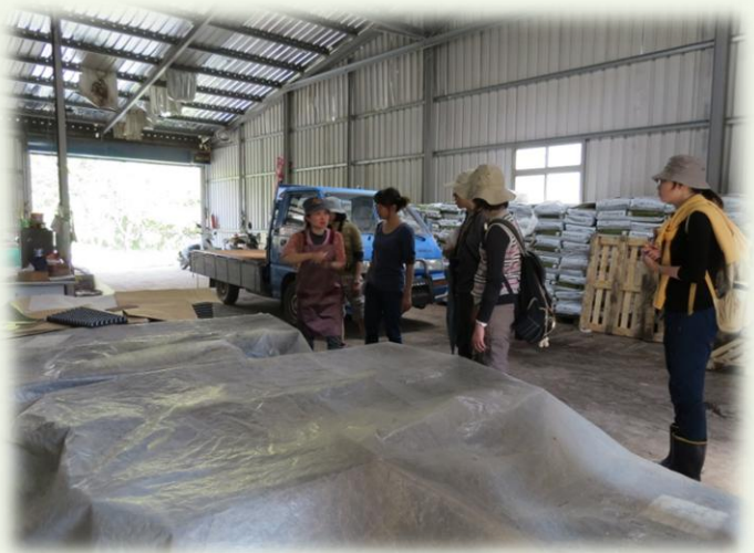
蓋上塑膠布，為剛播下的小苗保濕。