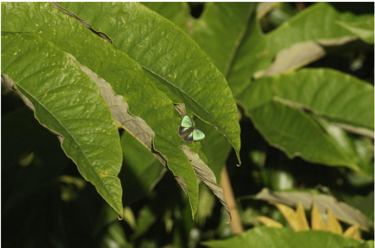
碧翠灰蝶雄蝶於蓬草上曬翅

為了傳宗接代，大多數的雄蝶都有領域性，此種翠灰蝶體型雖小，在捍衛地盤上可是不會輸，即使體型比牠大上七倍的曙鳳蝶、多姿麝鳳蝶、雙環翠鳳蝶，照樣驅趕不誤。