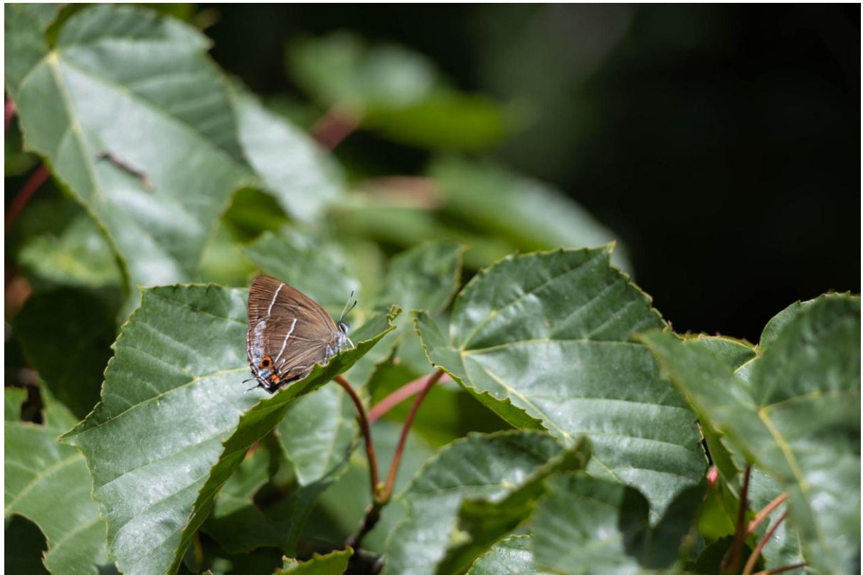
台灣檜翠灰蝶 攝於 2021/7/11 林庭緯