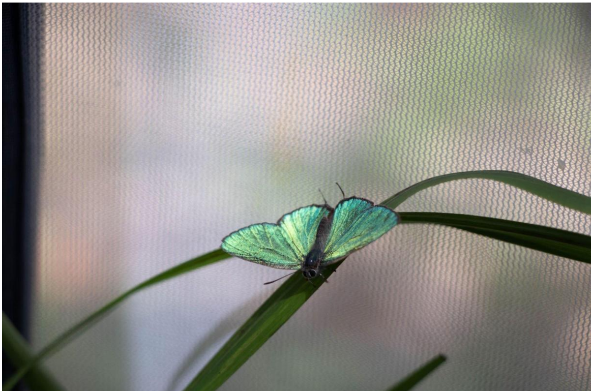
碧翠灰蝶雄蝶の腹面